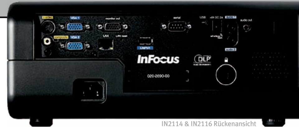
IN2114 & IN2116 Rückenansicht